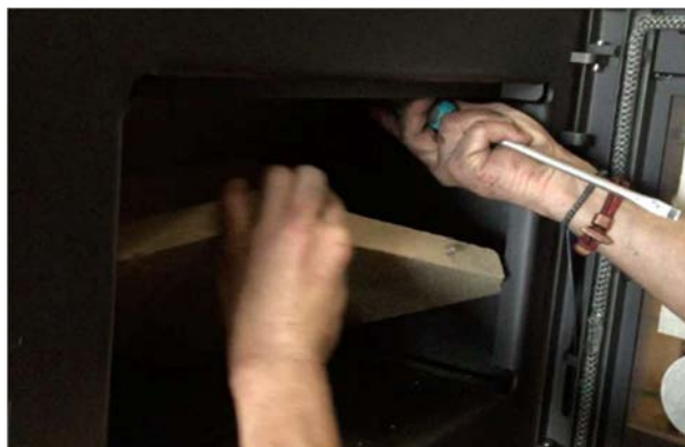
2) 上方の板を上を持ち上げて支えながら、右側の板を、ストーブのフレームに当たらないように慎重に向きを調整しながら取り出します。