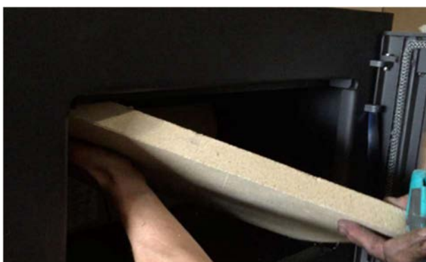
3) 支えていた上方の板も、慎重に向きや角度を変えながら、フレームに当たらないように抜き出します。