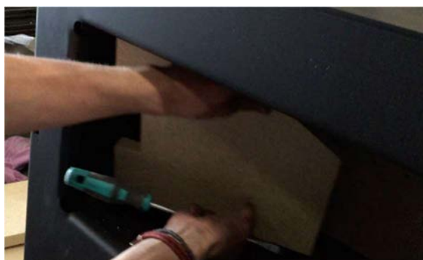
4) 左側の板を、右側の板と同様に、マイナスドライバー等を使って持ち上げ、抜き出します。